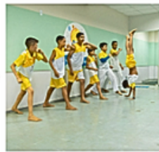
Aprendizagem e desenvolvimento integral