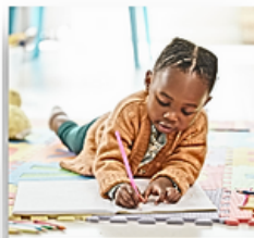
Cor ou Raça