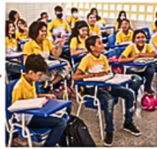
Permanência, bem-estar e participação