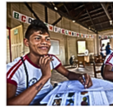
Jornada regular, com progressão e conclusão na idade adequada